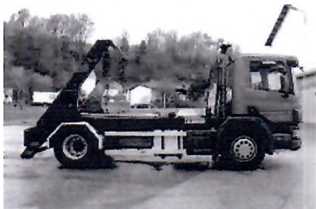
Фиг. 2 Примерно техническо оборудване за обслужване на съдове за строителни и едрогабаритни отпадъци от обектите на „Метрополитен“ ЕАД.

За осъществяване на дейностите по събиране и извозване на едрогабаритни и строителни отпадъци, Дружеството предвижда използването на 1 брой товарен автомобил, специализиран за сметосъбиране и сметоизвозване на битови/строителни отпадъци от контейнери с вместимост 4 м 3 и/или по голяма