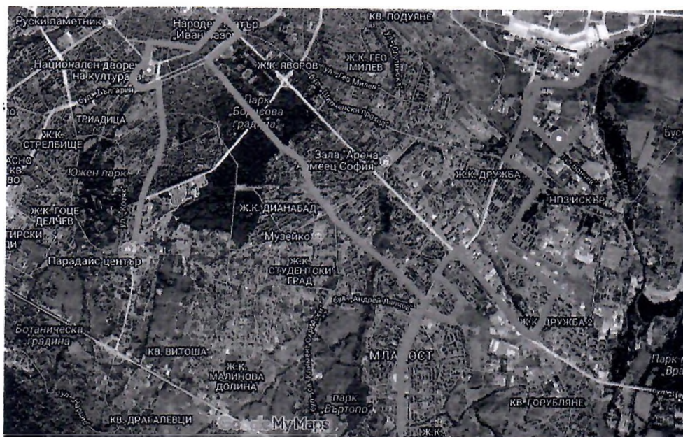
Фиг. 5 Маршрут 2