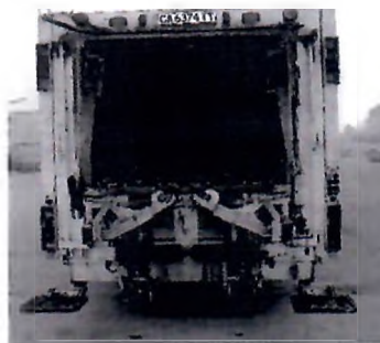
Фиг. 1 Примерно техническо оборудване за обслужване на съдове за битови отпадъци от обектите на „Метрополитен“ ЕАД.

За осъществяване на дейностите по събиране и извозване на едрогабаритни и строителни отпадъци, Дружеството предвижда използването на 1 брой товарен автомобил, специализиран за сметосъбиране и сметоизвозване на битови/строителни отпадъци от контейнери с вместимост 4 м 3 и/или по голяма