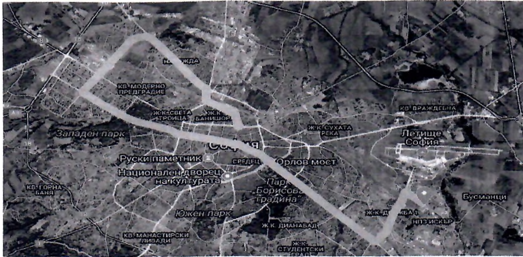
Фиг. 4 Маршрут 1

Маршрутът е с дължина 25,6 км. и включва обслужването на 43 броя контейнери тип „Ракла“, с обем 1100л.. Обслужването му се очаква да отнеме приблизително 3 часа и 55 минути.